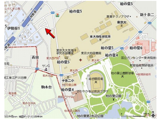
図面と現況が異なる場合は現況が優先となります。