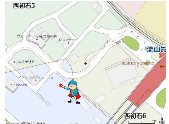
図面と現況が異なる場合は現況が優先となります。