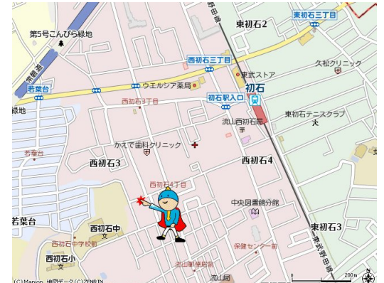
図面と現況が異なる場合は現況が優先となります。