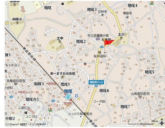
図面と現況が異なる場合は現況が優先となります。