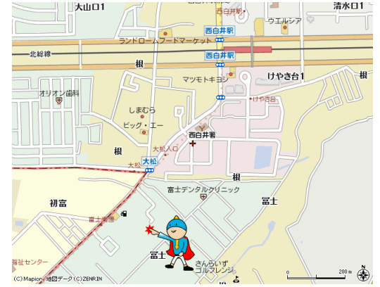
図面と現況が異なる場合は現況が優先となります。