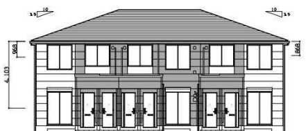
西 立面図 S=1:100