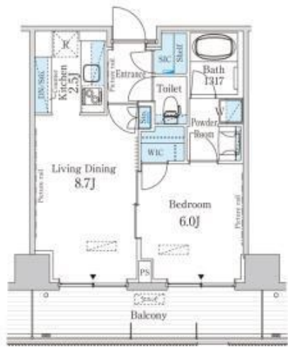
※バルコニーのガラス手摺、物干金物、壁の位置は住戸により異なります。 ※一部お部屋は、反転タイプとなります。